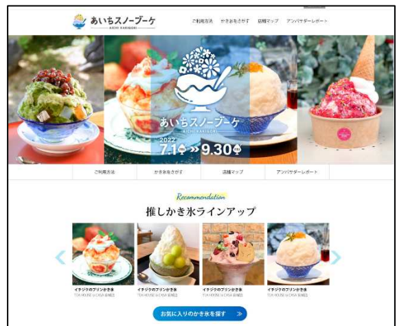
前回実施時の特設ホームページ

5 商品の設定期間（お客様がチケットを利用して店舗でスイーツが食べられる期間です。） 2023年7月1日（土）～ 2023年9月30日（土）